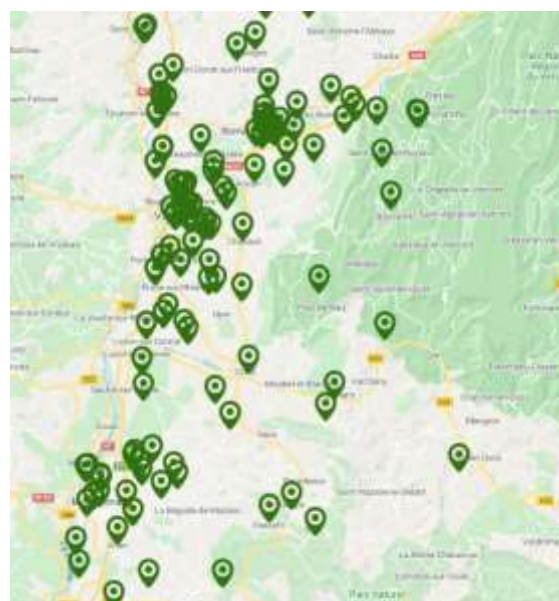
Carte : Nids de frelon asiatique détruits sur le département de la Drôme en 2019

Les conditions climatiques de l'année semblent avoir été défavorables au prédateur. Malgré tout, le frelon asiatique continue sa progression.